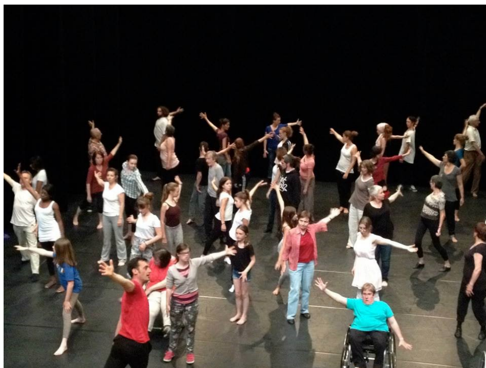
Warm up commun de tous les groups, festival 2015

Berne, Dampfzentrale du 5 au 9 juin 2019